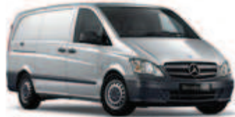
Brillantsilber metallic 1