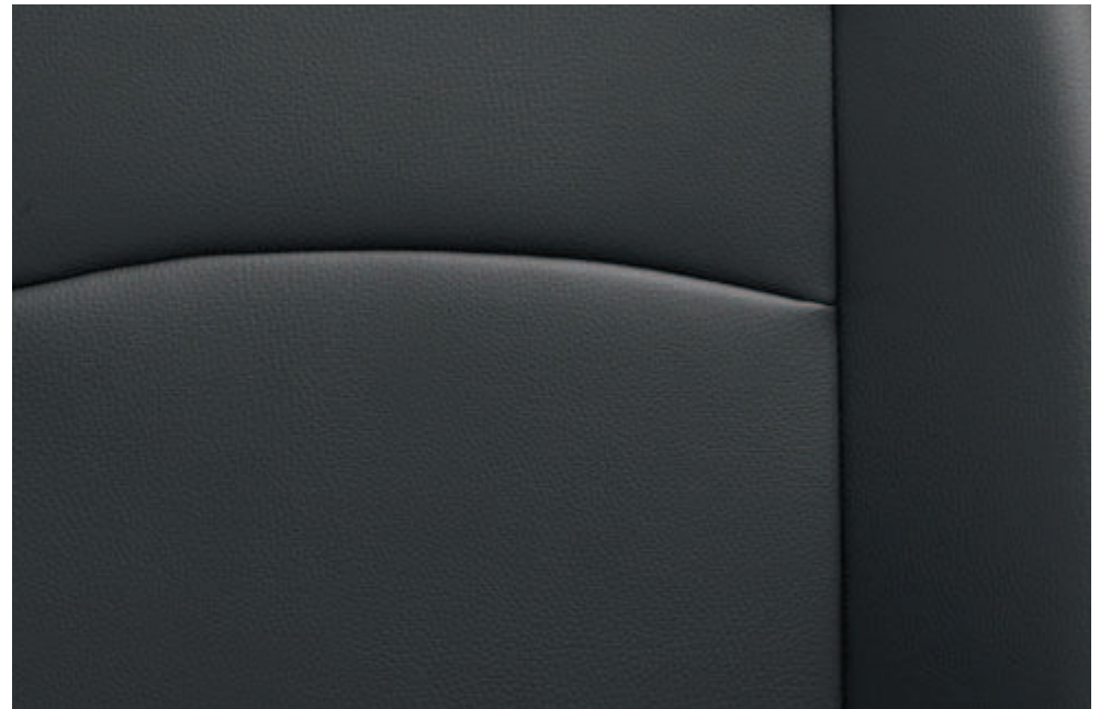
Kunstleder-Sitzbezug. Die neue, optional erhältliche, anthrazitfarbene Kunstlederausstattung ist abwaschbar, besonders pflegeleicht und strapazierfähig – und damit auch hohen Beanspruchungen gewachsen.