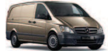
Sanidinbeige metallic 1