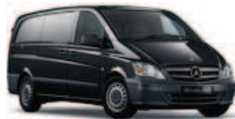
Obsidianschwarz metallic 1

Die hier gezeigten Serien- und Metalliclackierungen 1 sind nur ein kleiner Ausschnitt der möglichen Farben, in denen Sie Ihren Vito bekommen können. Auf Wunsch stehen insgesamt über 100 weitere Farben für Sonderlackierungen zur Verfügung. Auch Speziallackierungen, z. B. in der Hausfarbe Ihres Unternehmens, sind auf Wunsch möglich.