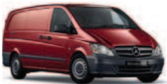
Bernsteinrot metallic 1