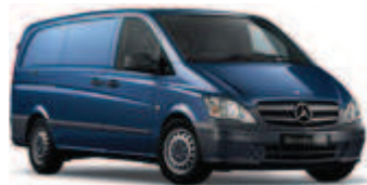
Jaspisblau metallic 1