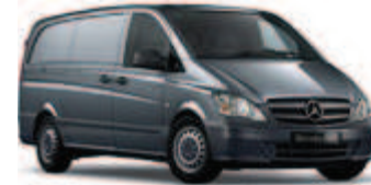
Flintgrau metallic 1