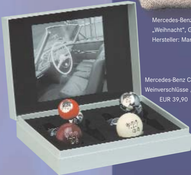
Mercedes-Benz Classic Weinverschlüsse „Vintage“ EUR 39,90