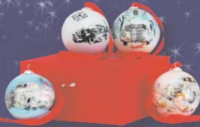
Mercedes-Benz Classic Weihnachtskugel-Set 2007, 4 Stück, handbemalt EUR 20,00