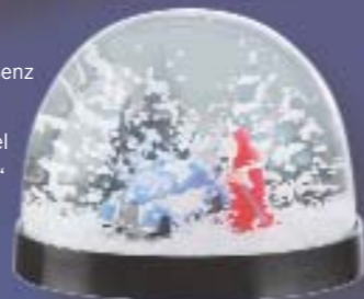
Mercedes-Benz Classic Schneekugel „Weihnacht“ EUR 12,90