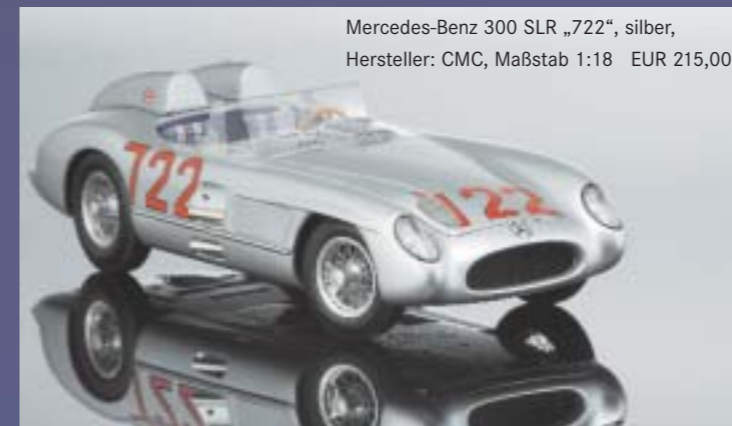
Mercedes-Benz 300 SLR „722“, silber, Hersteller: CMC, Maßstab 1:18 EUR 215,00