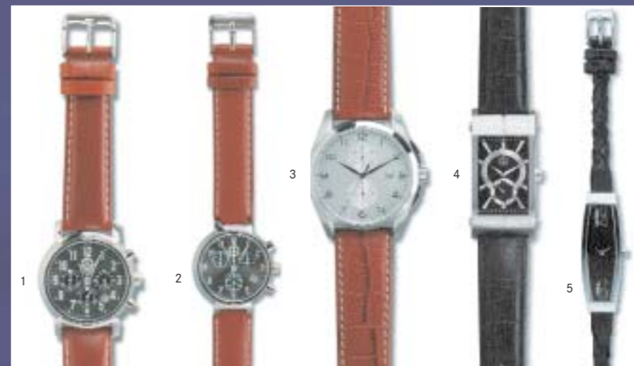
1 Mercedes-Benz Classic Chronograph „Avantgarde“ EUR 129,90 2 Mercedes-Benz Classic Damen-Chronograph „Avantgarde“ EUR 119,90 3 Mercedes-Benz Classic Chronograph „Grande“ EUR 149,90 4 Mercedes-Benz Classic Armbanduhr „Klassik“ EUR 99,90 5 Mercedes-Benz Classic Damen-Armbanduhr, schwarz EUR 99,00